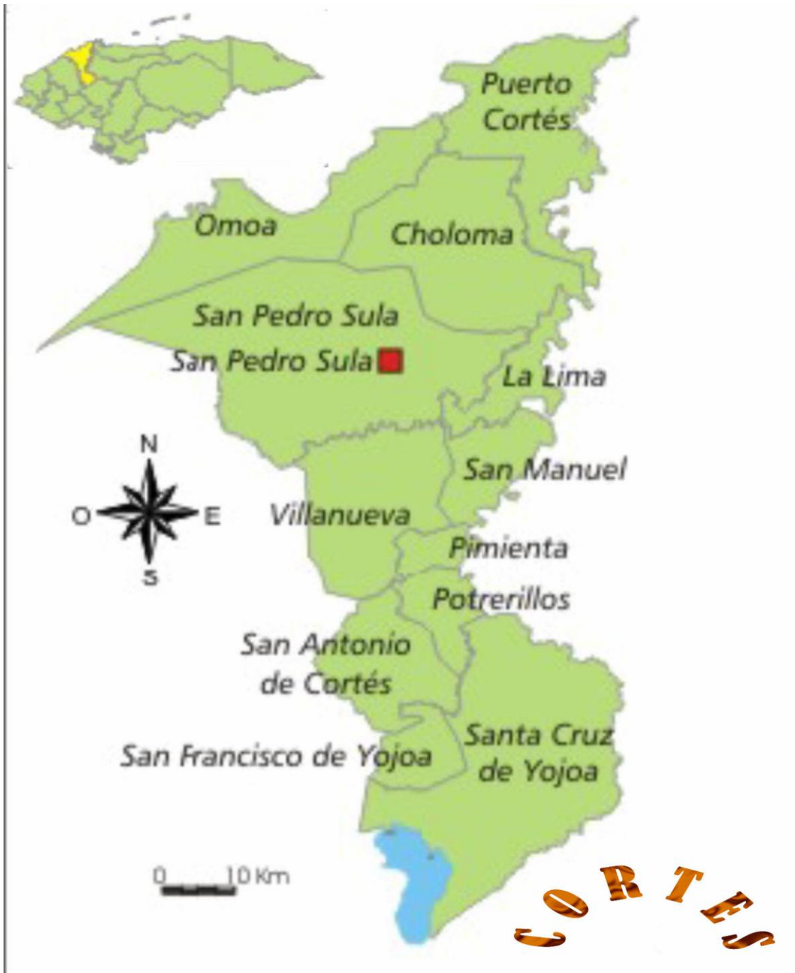
Mapa de Honduras